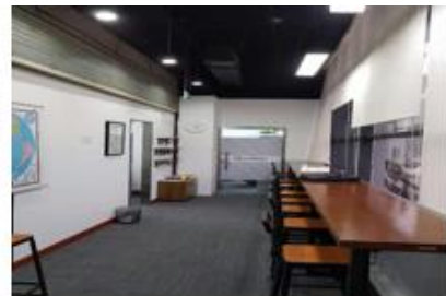
自由空间（共2个，6人间 1个，2人间 1个）