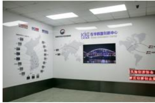
在华韩国创业中心（KIC中国）