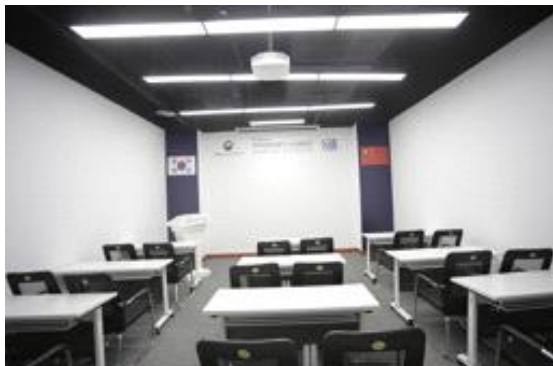
강연실 (20-30명 수용가능)