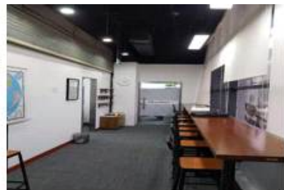
자유창업공간 (총 2개, 6인실 1개, 2인실 1개 )