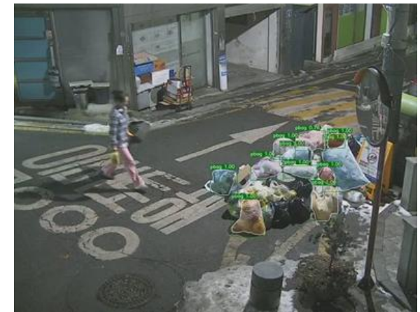
<사람 포즈와 물체 관계 활용 쓰레기 투기 탐지 기