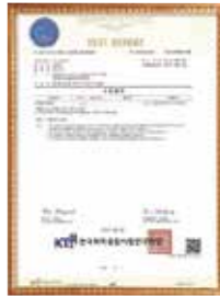
Effluent Test Report by KTR