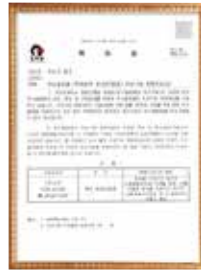
Priority Purchase Recommendation by KIPO