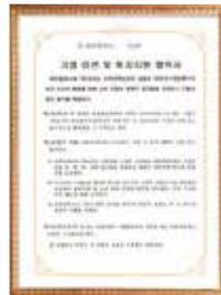
MOU with Daejeon city