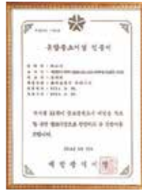
Promising SME Certificate