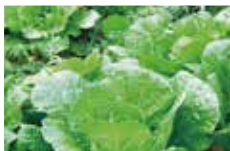
< 用排放水施肥的健康的白菜 >