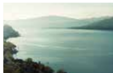
< 水质净化 >