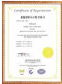
Quality Management System Certificate