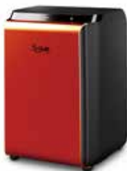
HOLY-H 家庭用 环保食物垃圾处理

公司持有13项世界最高水平的专利技术。被评为[大田广域市有望中小企业], 调达厅备案(2015.4.30), 荣获2015第10届数码技术革新环保技术领域大奖(2015.7.22) 2015年被授予大韩民国发明专利大奖(2015.11.26)。