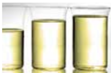
< 处理后排放水 >