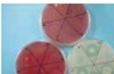
< 去除复合微生物制剂 >