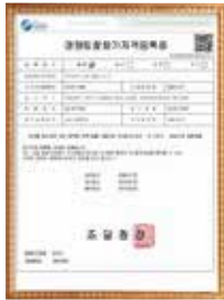
Government Bidding Registration License