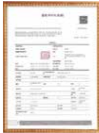
PPS Transaction Contract