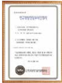
R&D department Certificate