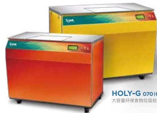
HOLY-G 0701099 大容量环保食物垃圾处理