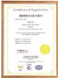
Environment Management System Certificate